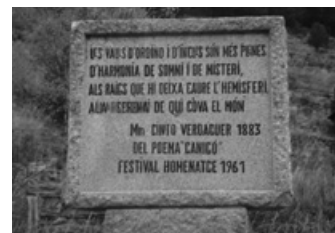
Pedró en homenatge a mossèn Cinto Verdaguer. Vall d'Incles, Andorra, 1961