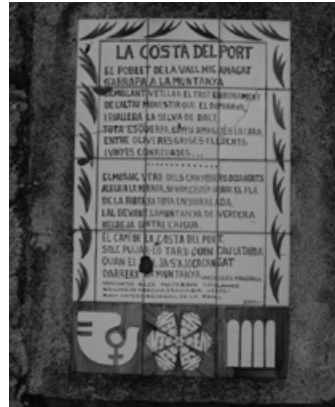
Majòlica al camí de Sant Pere de Roda. Homenatge a les poetesses catalanes. 1975